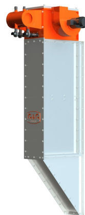
вертикальное исполнение фильтра