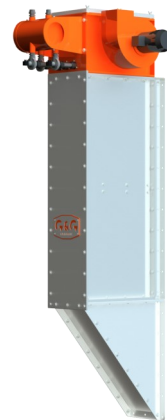
вертикальное исполнение фильтра